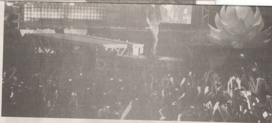
Luan Santana agitou a platéia na primeira noite de shows da Expo 2014

ontanha, (Norte); São José, te); Colé- é Guima- Estadual o Mário Cianorte légio Cezari- Estadual rski, em égio Es- lves dos ntamento Santos, o Iguaçu Colégio mpo Dis- Joaquim oneiro); al Zélio Pitanga ) e Co- rofessor da Silva, orte).